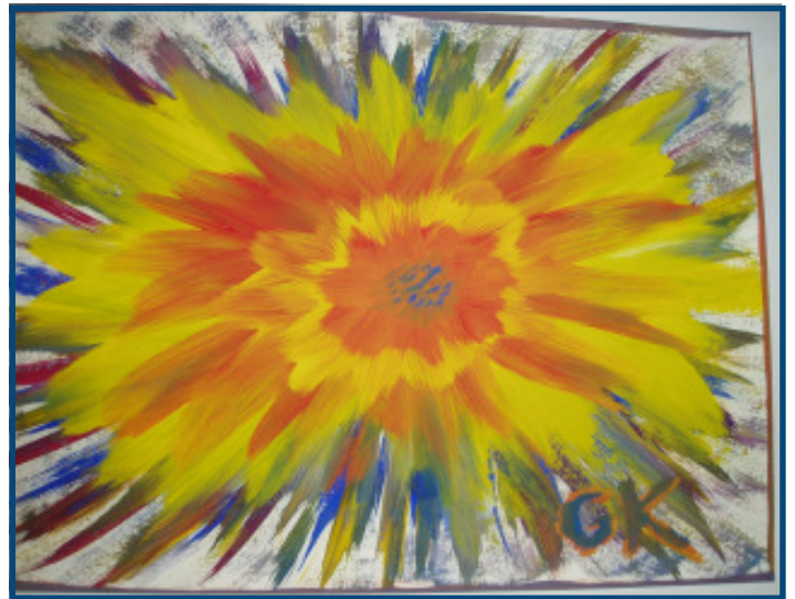
Ein Teil der in dieser Ausgabe abgebildeten Kunstwerke stammen aus der von Ellnamaj Schedelberger geleiteten Kreativhöhle, die zwei mal wöchentlich im Atelier Sonnensegel stattfindet.