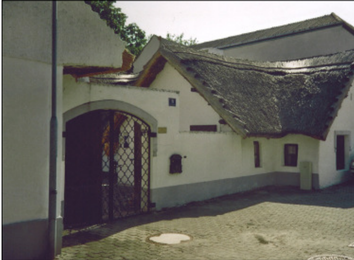
Der diesjährige Malurlaub geht wieder nach Illmitz / Burgenland

Das Projekt Atempause von pro mente austria bietet ein aktivierendes Integrations- und Trainingsprogramm an und soll Betroffenen helfen, Freizeitkompetenz zu entwickeln und die eigene Genussfähigkeit zu entdecken und erleben.