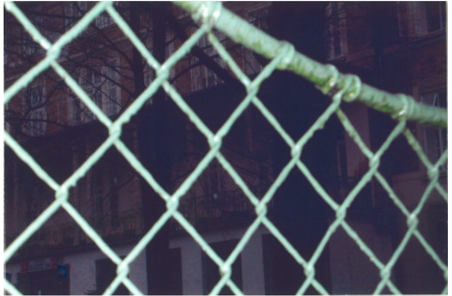
Texte und obiges Bild von Martina Steyrer

Ein Experiment. Und im Traum wollt´ ich lachen, doch Punkt halb sieben - ich war zu Hause - läutete der Wecker und der Traum hat kein Ende.